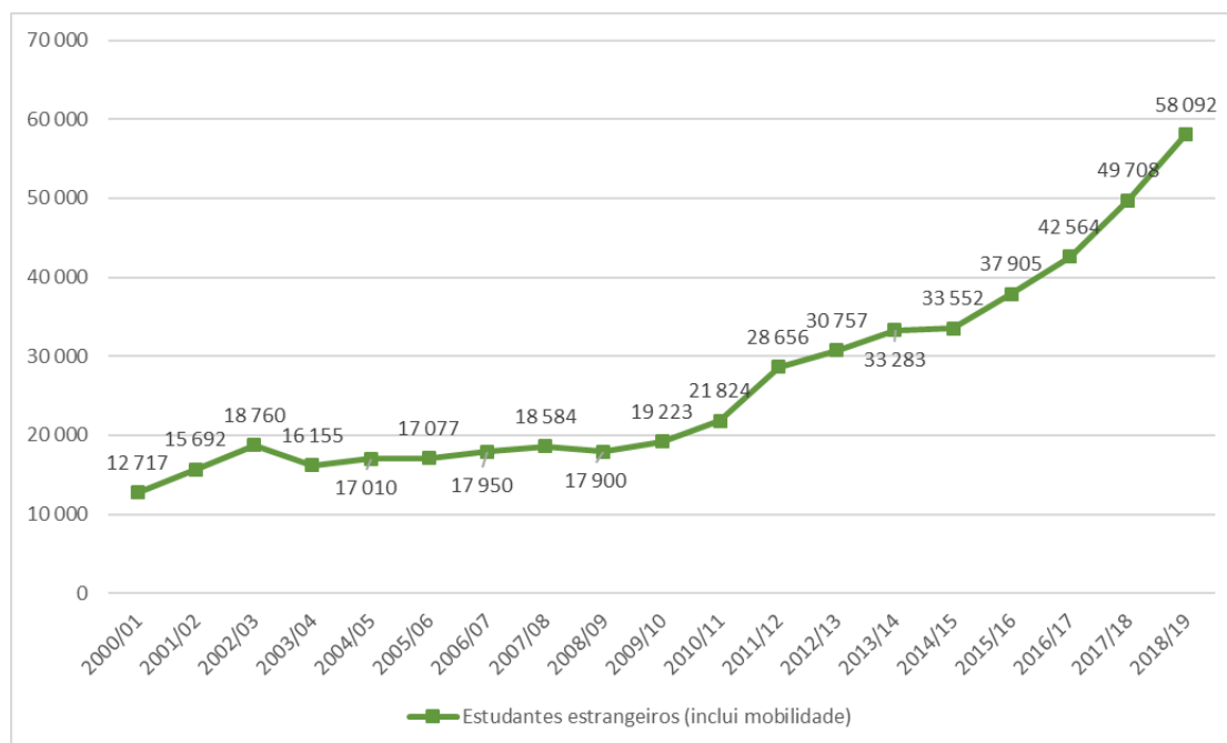
Figura 1 – Evolução do número de estudantes estrangeiros matriculados, incluindo estudantes em mobilidade e estudantes com estatuto de “estudante internacional” (2000/01 a 2018/19)

Mais de 58 mil estudantes de nacionalidade estrangeira estavam matriculados no ensino superior no ano letivo de 2018/19, incluindo estudantes em mobilidade e estudantes com estatuto de “estudante internacional” nos vários ciclos de estudo (licenciatura, mestrado e doutoramento). Este valor corresponde a cerca de 15% do total de inscritos no ensino superior em Portugal, tendo aumentado 76% em relação a 2014/2015, quando estavam inscritos cerca de 33 mil estudantes de nacionalidade estrangeira em Portugal. A atualização dos dados de estudantes em mobilidade é divulgada em julho de cada ano.