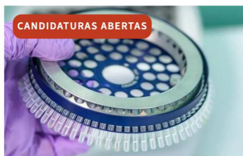
Ciências Biomédicas e da Saúde