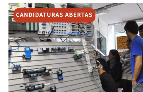
Engenharia Mecatrónica / Ramo Aeronáutica