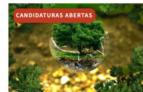
Biologia e Geologia

Prémios mérito, she, + diploma, microjovem: