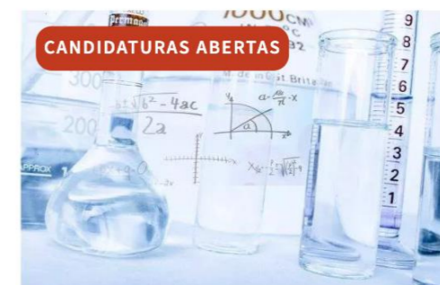
Física e Química