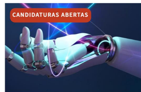
Inteligência Artificial e Ciência de Dados