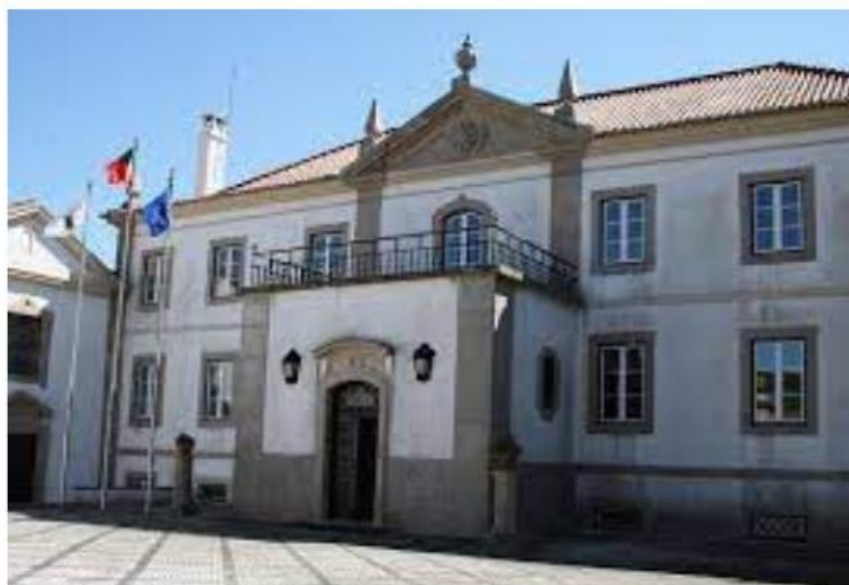
EN de Bombeiros - Sintra