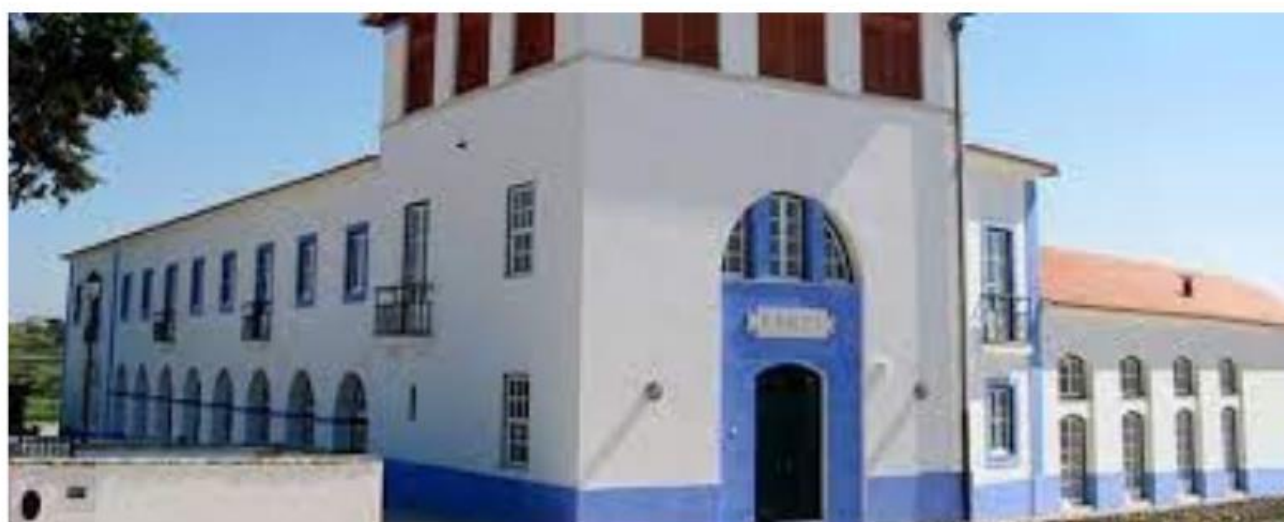
ER do Património - Sintra