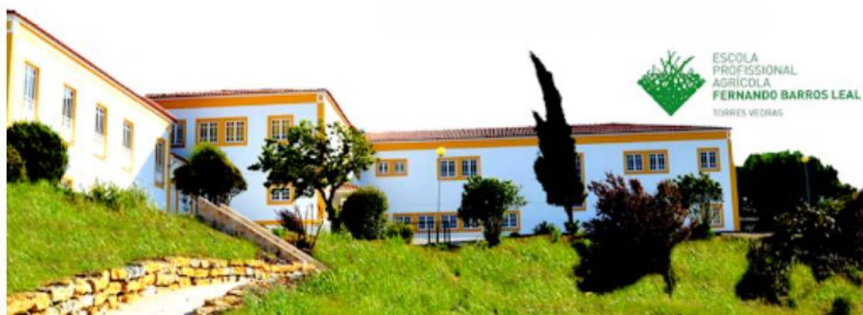
EP Agrícola Runa - Torres Vedras