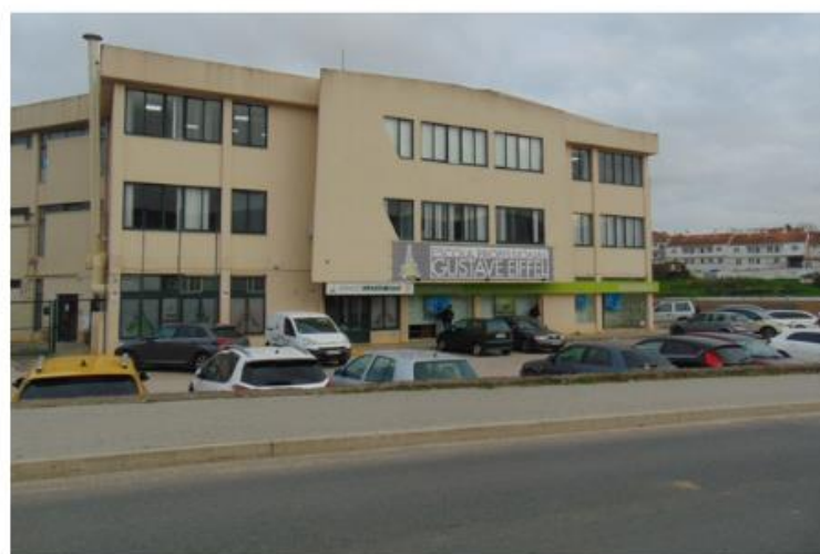
EPGE - Arruda dos Vinhos