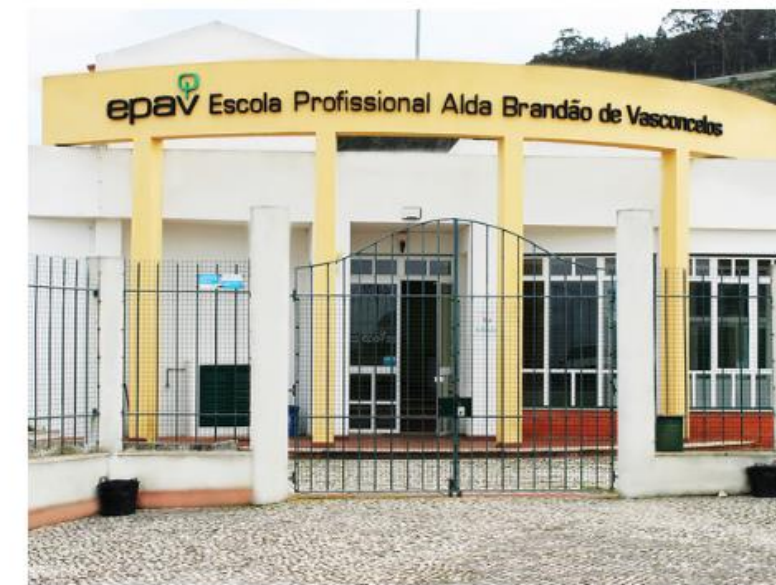
EP Alda Brandão - Colares