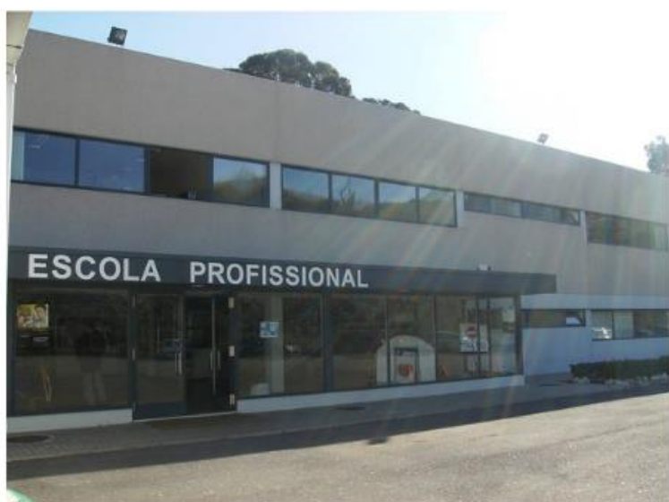
IPTrans - Loures