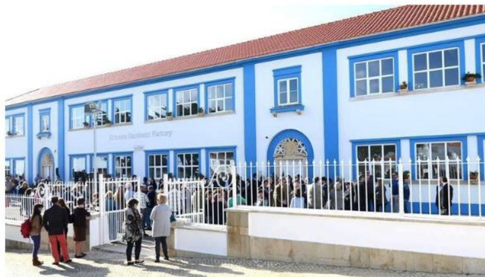
Ericeira Business Factory