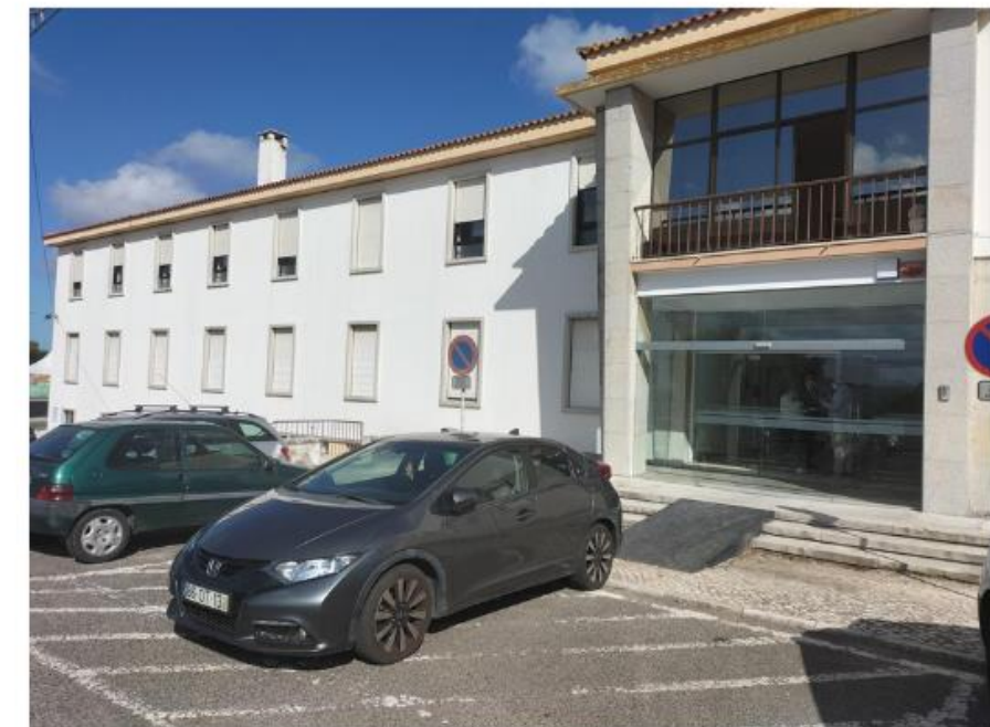
Antigo Hospital da Misericórdia- Mafra