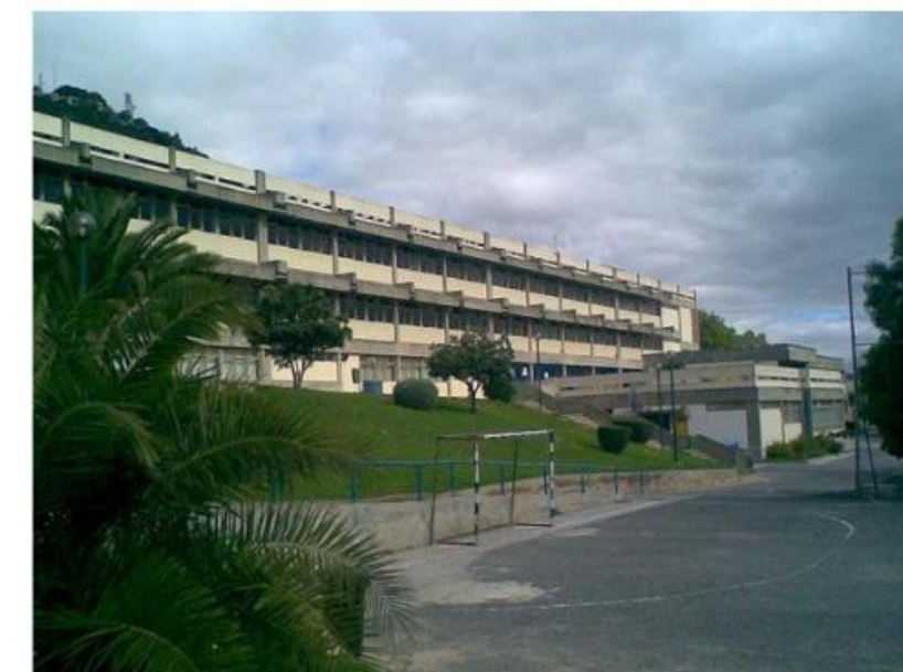
ES Alves Redol - Vila Franca